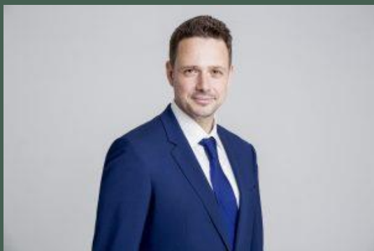
Rafał Trzaskowski Prezydent Miasta Stołecznego Warszawy