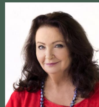
Anna Dymna – aktorka, założycielka i prezes Fundacji „Mimo wszystko”

Konsultant Krajowy ds. Psychologii Klinicznej